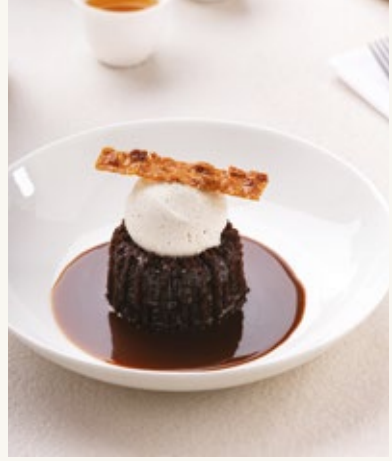
بودنج التمر والتوفي

٥٩ تري ليتشي المانجو كعكة إسفنجية خفيفة في شراب الطيب، تقدم مع كومبوت المانجو، صوص المانجو، مغطاة بشرائح اللوز.