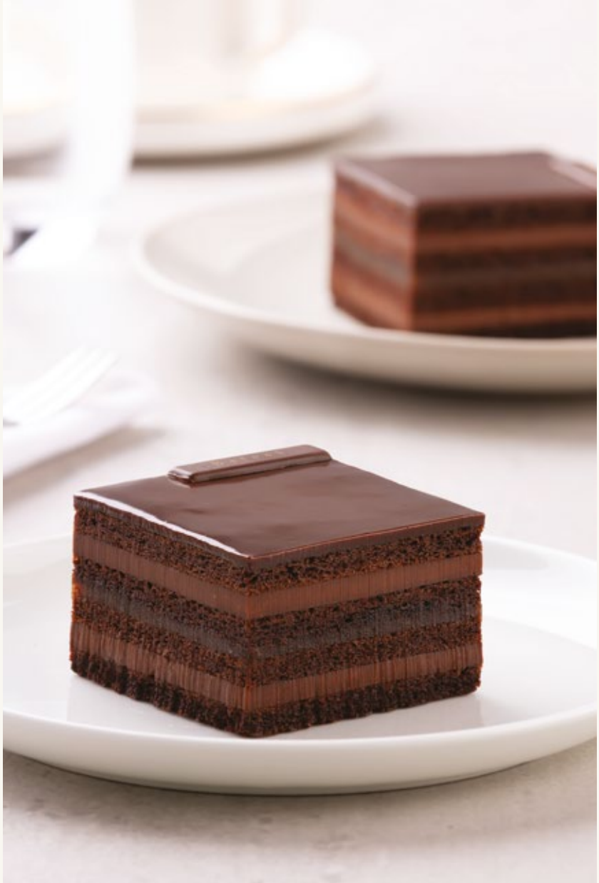
كـيكة الشوكولاتة والتمر

من خلال الجمع بين الذوق الإبداعي واحترام التقاليد ، يقوم طهاة المعجنات الخبراء لدينا بإعداد مجموعة مغربية من الحلويات الأصيلة والمعاصرة.