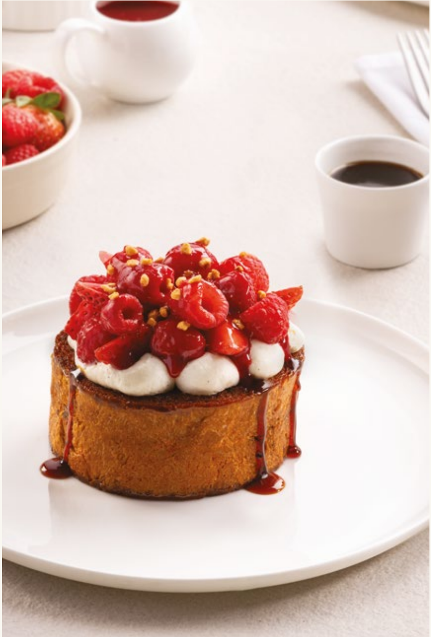
توست فرنسي بالشوكولاتة

محضرة من أصناف مختلفة من التمر من مزارعنا في المملكة العربية السعودية ، بودنج التمر من بتيل خفيف ولذيذ.