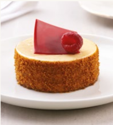
تشيز كيك التوت والفانيلا

بسكويت شوكولاتة مع كريمة حبوب التونكا المميزة، موس شوكولاتة مدغشقر الداكنة، البرالين المقرمش والغيو تيلين.