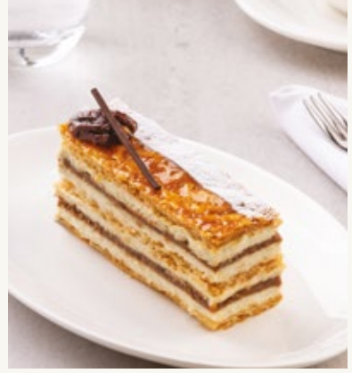
ميلفاي التمر والبقان

تشيز كيك تقليدي مكرمل على الطريقة الباسكية مع كومبوت التوت.