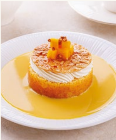
تري ليتشي المانجو