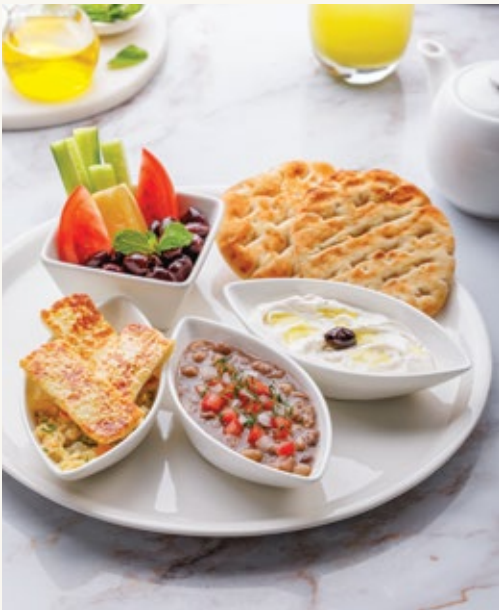
طبق بتيل الشرقي

تشكيلة من أطباق فول أوميريا المحضرة على الطريقة المنزلية، اللبنة، جبن الطلوم المشوي، بابا غنوج، زيتون ليغوريا، نعناع، طماطم، خيار، وخبز البيتا الدافئ.