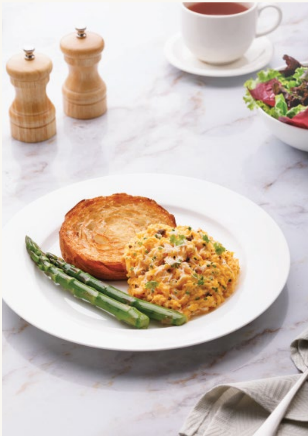
البيض المخفوق مع الكمأة

يتم إعطاء أطباق البحر الأبيض المتوسط الكلاسيكية لمسة بتيل ، مع التركيز على مكونات الموسم الطازجة وأفضلها.