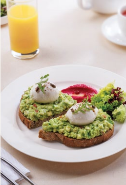
توست بتيل بالأفوكادو