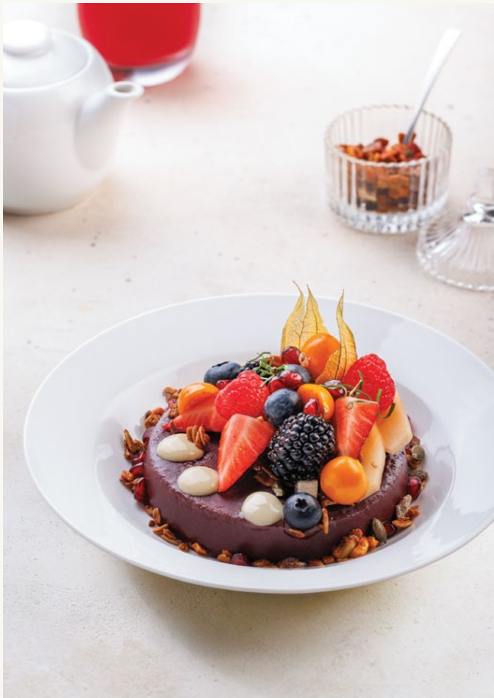
طبق آساي باول المتوسطي

تم انتقاء تمر بتيل العضوية بعناية من مزرعتنا في المملكة العربية السعودية، وهي إضافة لذيذة ومميزة لوجبة فطور صحية.