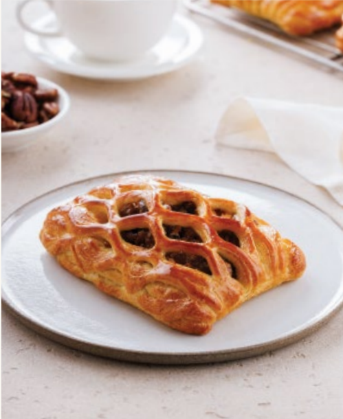
فطيرة التمر والبقان