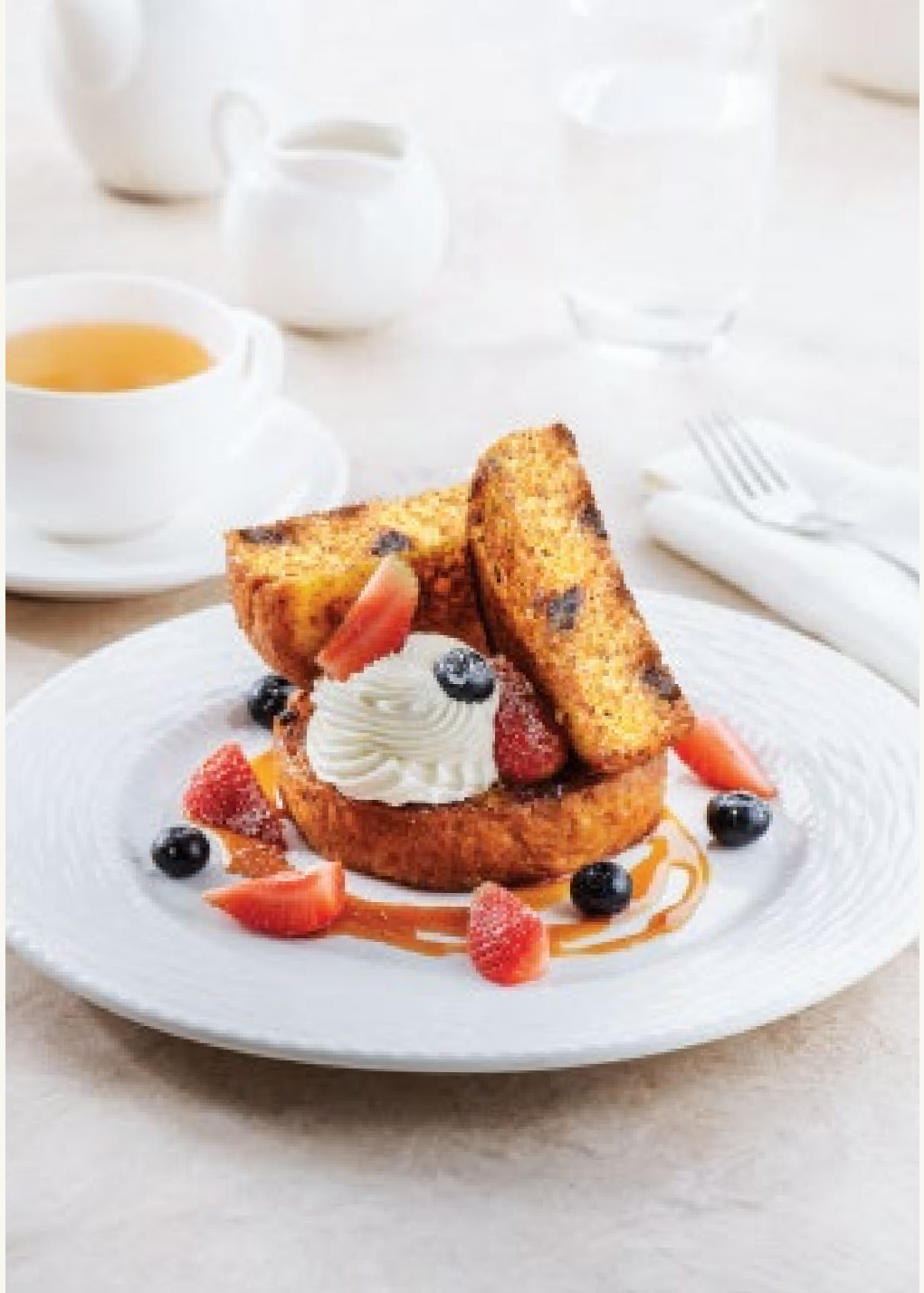
توست فرنسي بالتمر

يتم إعداد مجموعة المخبوزات الخاصة بنا بشكل طازج كل يوم من قبل خبازين حرفيين باستخدام دقيق استثنائي وتقنيات أصلية.