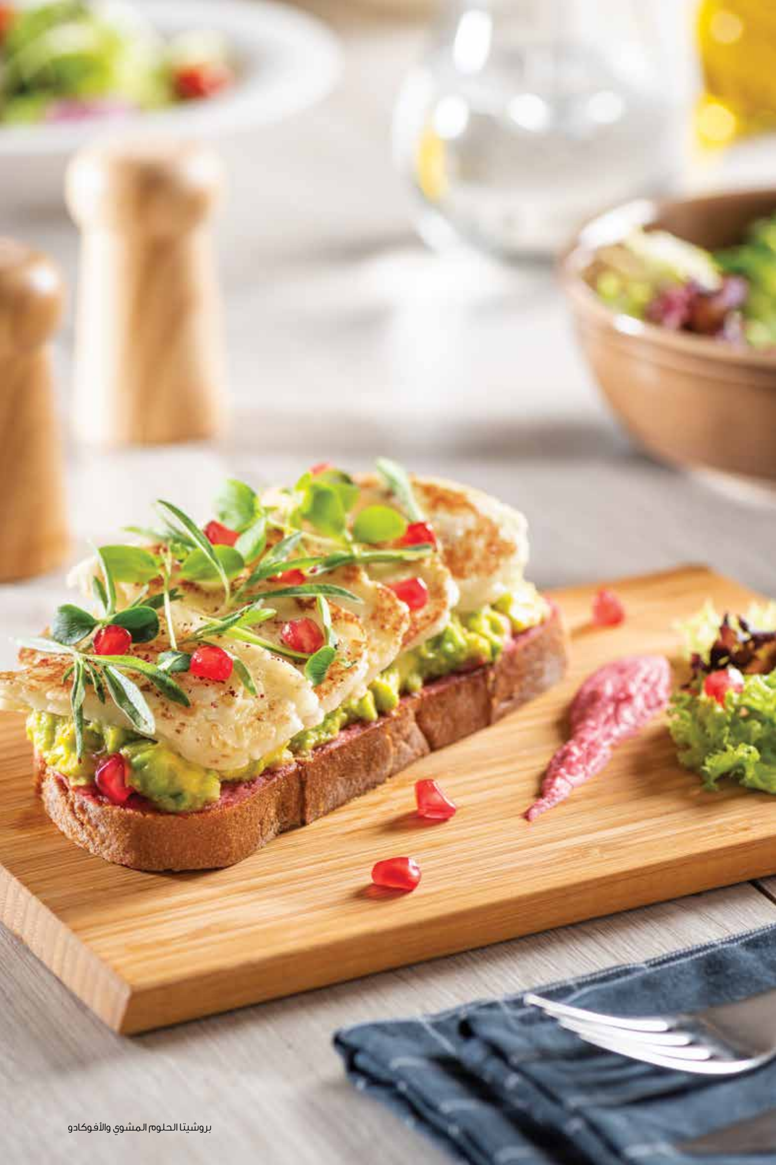
بروشيتا الطحوم المشوي والأفوكادو