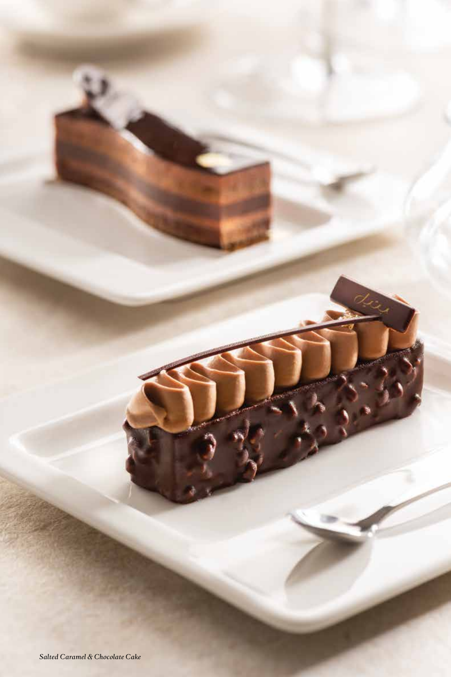
Salted Caramel & Chocolate Cake