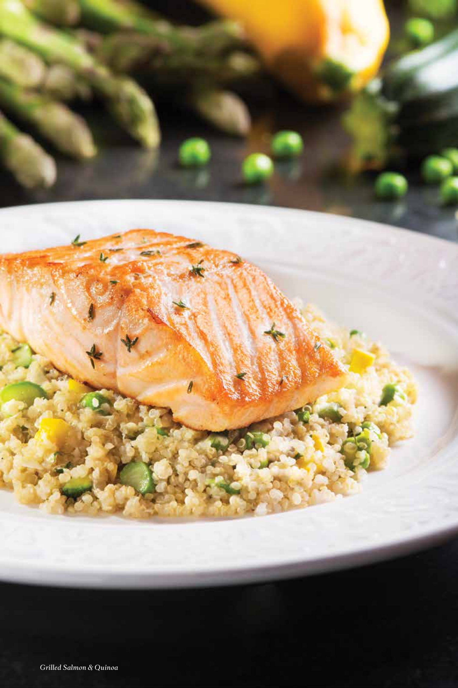
Grilled Salmon & Quinoa